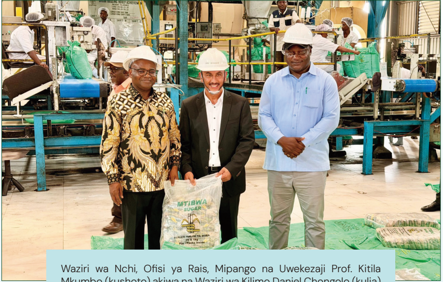
Waziri wa Nchi, Ofisi ya Rais, Mipango na Uwekezaji Prof. Kitila Mkumbo (kushoto) akiwa na Waziri wa Kilimo Daniel Chongolo (kulia) katika ziara ya kutembelea sekta ya sukari nchini.