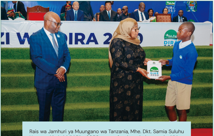
Rais wa Jamhuri ya Muungano wa Tanzania, Mhe. Dkt. Samia Suluhu Hassan akimkabidhi Dira 2050, mwanafunzi wa shule ya msingi ikiwa ni ishara ya maendeleo jumuishi na ustawi wa pamoja.