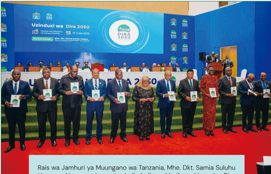
Rais wa Jamhuri ya Muungano wa Tanzania, Mhe. Dkt. Samia Suluhu Hassan akiwa na viongozi mbalimbali wa kitaifa wakionesha Dira 2050 baada ya kuzinduliwa jijini Dodoma tarehe 17Julai, 2025.