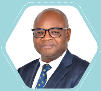
MHE. PROF. KITILA ALEXANDER MKUMBO (MB), WAZIRI WA NCHI, OFISI YA RAIS, MIPANGO NA UWEKEZAJI