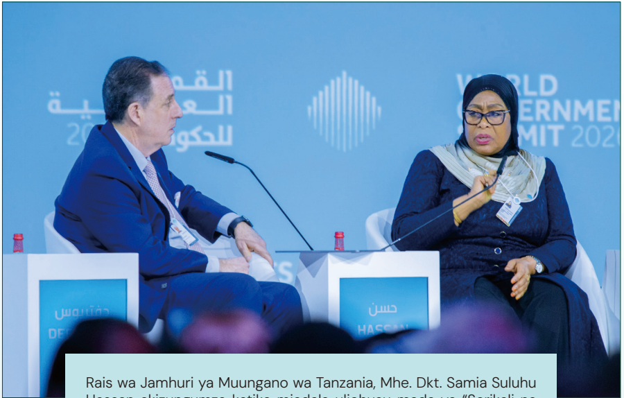
Rais wa Jamhuri ya Muungano wa Tanzania, Mhe. Dkt. Samia Suluhu Hassan akizungumza katika mjadala uliohusu mada ya “Serikali na Mustakabali wa Uwekezaji Mtazamo wa Afrika” kwenye Jukwaa la Serikali za Dunia (WGS2026), Madinat Jumeirah, Dubai, Umoja wa Falme za Kiarabu (UAE) tarehe 4 Februari, 2026.